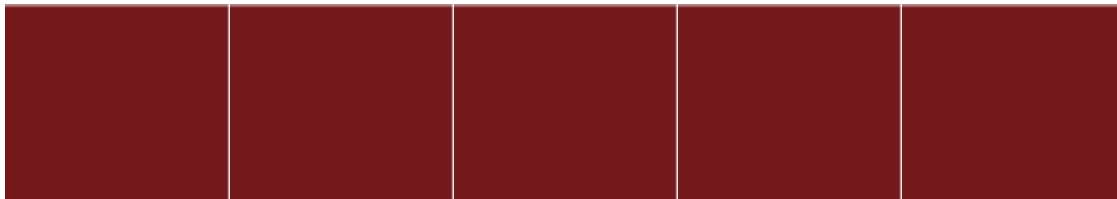
Figuur 1: Stappen Meldcode, oude situatie

Dit betekent een paradigmawisseling. Het doen van een melding bij Veilig Thuis is voor beroepskrachten tot op heden vooral als een 'last resort', een laatste toevlucht op het moment dat een beroepskracht zelf niet in staat is adequate hulp te verlenen. Veilig Thuis neemt dan de verantwoordelijkheid van de hulpverlener over. Melden en zelf hulpverlenen lijken elkaar uit te sluiten. Deze manier van kijken zat ook besloten in het oorspronkelijke 'Basismodel meldcode huiselijk geweld en kindermishandeling', waarbij de beroepskracht in stap 5 gevraagd werd te beslissen tussen of 'hulp bieden/organiseren' of 'melden' (figuur 1). Hierbij geldt dat beroepsgroepen op basis van dit algemene model beroepsspecifieke uitwerkingen hebben gemaakt. Daardoor wordt in de Meldcodes voor sommige beroepsgroepen in stap 5 expliciet onderscheid gemaakt naar een stap 5a en 5b voor respectievelijk zelf hulp bieden of organiseren en melden.